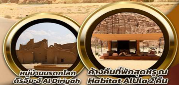
หมู่บ้านมรดกโลก ดิรัยยะฮ์ AlDiriyah