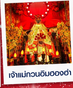
เจ้าแม่กวณอิรม์สองฮ่า