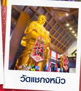
วัดแซกงหมีว