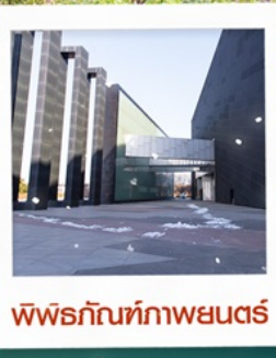
พีฟุรกกันท์กาพยนตร์