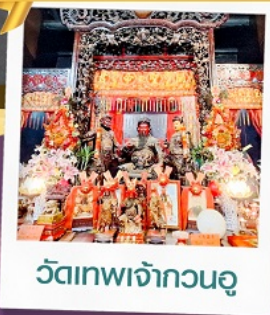
วัดเทพเจ้ากวนอู