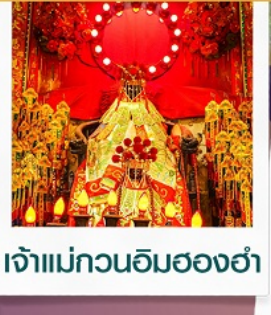
เจ้าแม่กวนอิมฮ่องกง