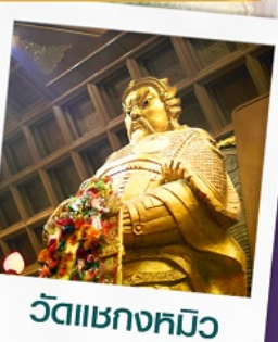
วัดเขากงหมิว

📅 เดินทางตรง วันหยุด ตุลาคม-ธันวาคม 2567