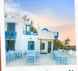
ซานตารีน้ำกาแฟ