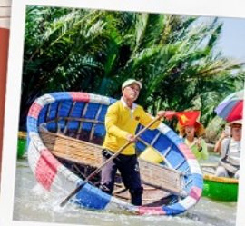
ล่องเรือกระดังง์