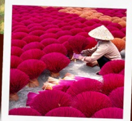
หมู่บ้านรูป