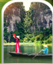
ล่องเรือตามก๊ก (ฮาลองบ๊ก)

เที่ยว 4 วัน 3 คืน เดินทาง กันยายน - ธันวาคม 67