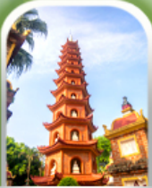
เจดีย์เงินทิวัก