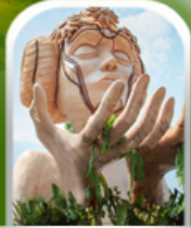
โมอาน่า คาเฟ่