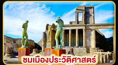
ชมเมืองประวัติศาสตร์ ปอมเปอี