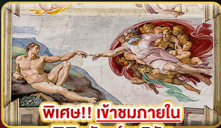
พิเศษ!! เข้าชมภายใน พิพิธภัณฑ์วาติกัน