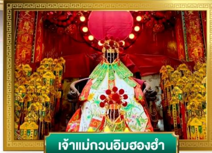
เจ้าแม่กวนอิมสองห้า