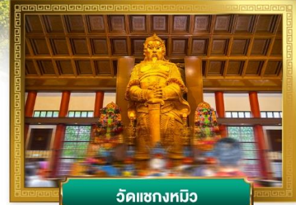
วัดแชกงหมิว