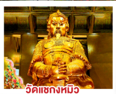
วัดแขกหมิว