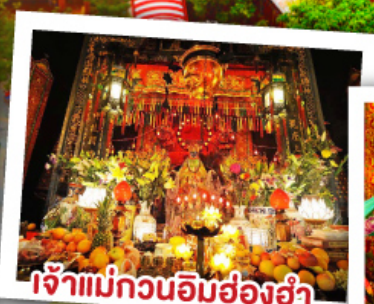
เจ้าแม่กวนอิมฮ่องฮ่า