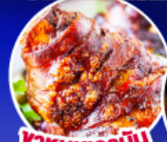
พาหมูเยอรมัน