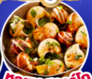
หอยเอสคาร์โก

เดินทาง 11-19 ต.ค.67 / 14-22 พ.ย.67 25 ธ.ค.67 - 2 ม.ค.68 (เทศกาลปีใหม่)