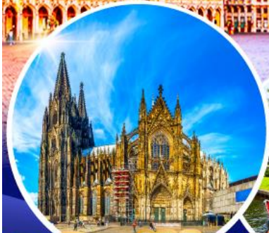
มหาวิหารแห่งโคโลญ