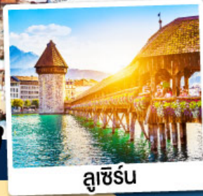
ลูซิิร์น

พิเศษ!! อาบน้ำแร่แช่น้ำอุ่น ณ เมืองลูคอร์เนค เมืองแห่งน้ำแร่สวิตเซอร์แลนด์