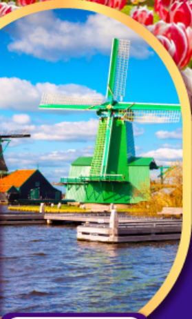
หมู่บ้านกังหันลมชาคินส์