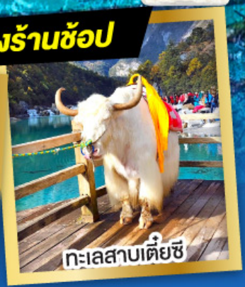
ทะเลสาบเตี้ยซี