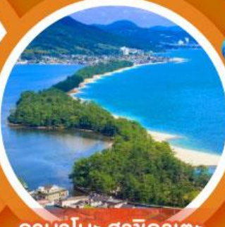
อามาโนะ ฮาชิคาเตะ