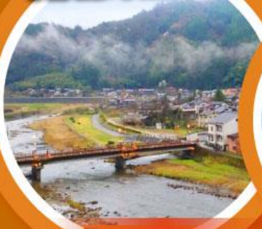
มิซาซาออนเซน

เที่ยวเต็มทุกวันไม่มีฟรีคีย์ ชมเนินทรายทตริที่ใหญ่ที่สุดในญี่ปุ่น ตามรอยกูดน้อย คิตาโร่ และโคมัน นั่งกระเช้าชมวิว 1 ใน 3 ที่สวยที่สุดในญี่ปุ่น “อามาโนะ ฮาชิคาเตะ”