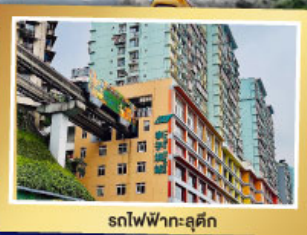
รถไฟฟ้า-ลูตึก