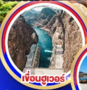
เชื้อนฮูเวอร์

ช้อปปิ้งจุใจเอ้าท์เล็ตออนตารีโอมิลล์ ช้อปปิ้งบาร์สไควเอ้าท์เล็ต