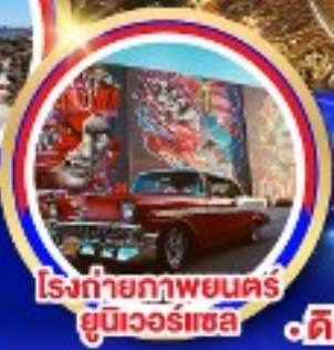
โรงถ่ายภาพยนตร์ ยูนิเวอร์แซล