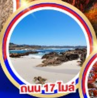
ถนน 17 ไมล์