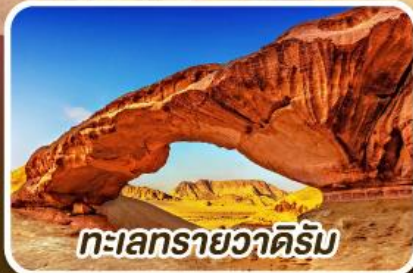
ทะเลทรายวาดีรัม