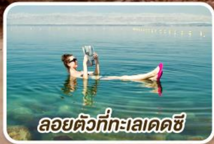
ลอยตัวที่ทะเลเดดซี