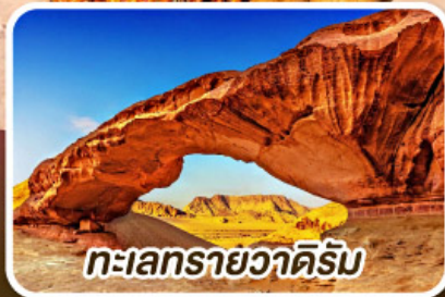
ทะเลทรายวาดีรัม