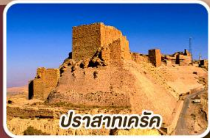
ปราสาทเครีค