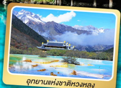
อุทยานแห่งชาติหลวงหลอง