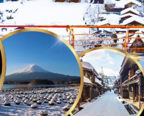
สวนโออิชิ พาร์ค ทาคายาม่า