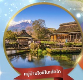
หมู่บ้านโอชิโนะซึกิโก