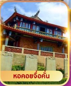
หอคอยจ้อคั่น