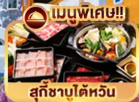
เมนูพิเศษ!!