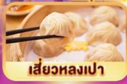
เสี่ยวหลงเปา