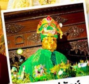
ซอพรแม่ยักย์