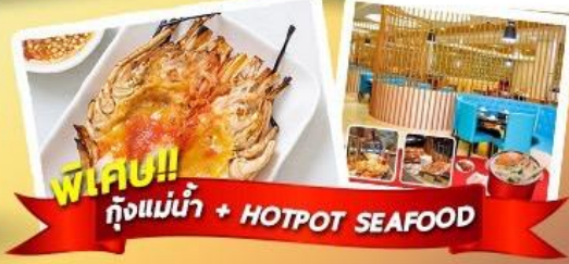
พิเศษ!! ก๊วยแม่น้ำ + HOTPOT SEAFOOD