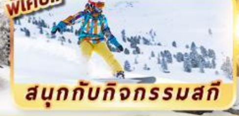
สนุกกับกิจกรรมสกี