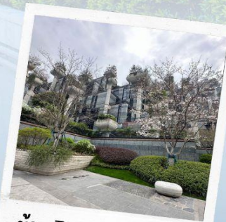
ห้าง Tian AN 1,000