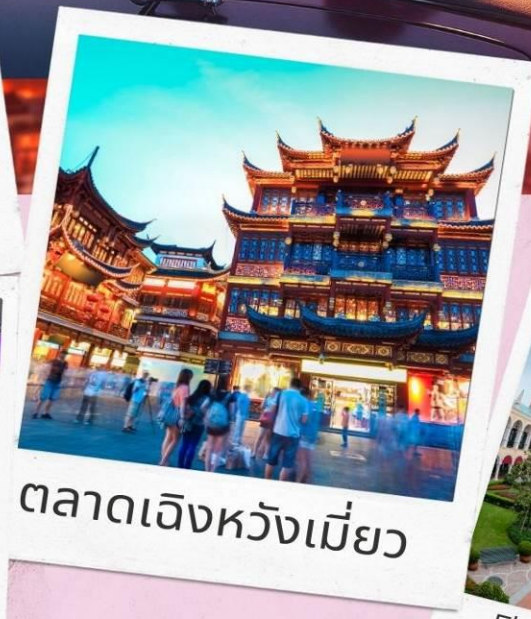
ตลาดเจิ้งหวังเมี่ยว