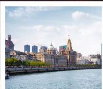
หาดว่อกาน