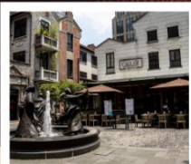
ซินเทียนตี้