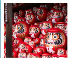
วัดคิตสึโอจิ