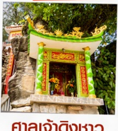
ศาลเจ้าติงซา