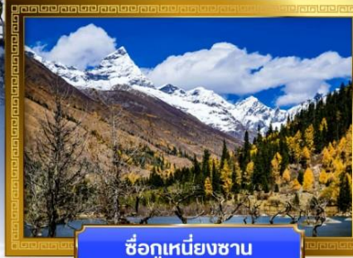
ชื่อภูเขาเหมียงชาน