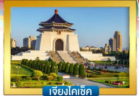
เจียงไคเช็ค