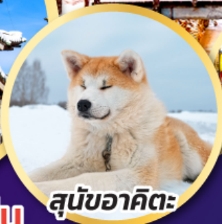
สุนัขอาคิตะ