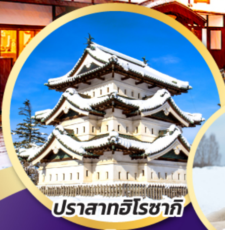
ปราสาทอิโรซากิ