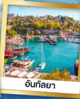
อันกึลยา