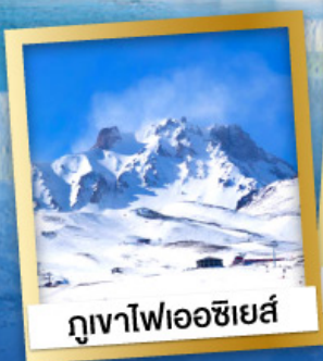
ภูเขาไฟเอเซียส