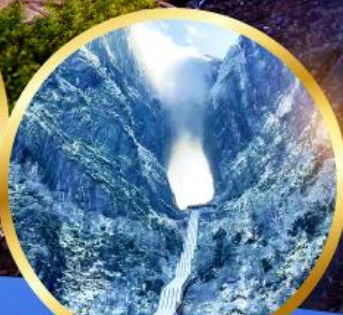
ประตูสวรรค์ เขียนเหมินชาน