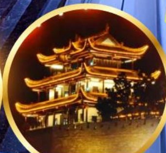
หอคอยทองคำเทียนชิน