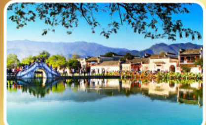
หมู่บ้านผดโลก หงซุน