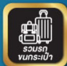
รวมรถ ขนกระเป๋า