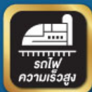
รถไฟ ความเร็วสูง