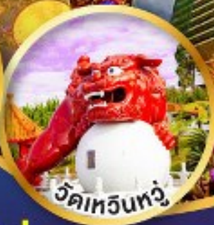
วัดเหวินทง