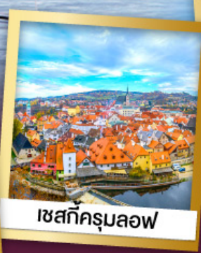
เซสกีครุมลอฟ