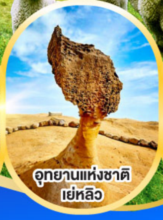
อุทยานแห่งชาติ เยหลิว