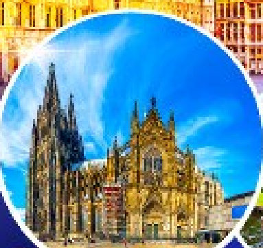
มหาวิหารแห่งโคโลญ