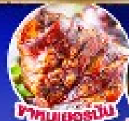
ไก่ทอดเยอรมัน