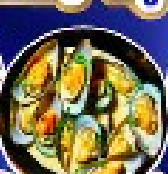
หอยนางรมฝรั่งเศส