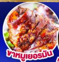
ขาหมูเยอรมัน