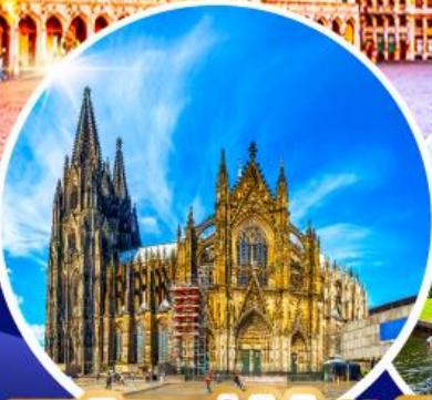
มหาวิหารแห่งโคโลญ หมู่บ้านกีธูร์น