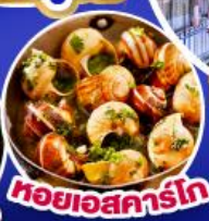
หอยเอสคาร์โท