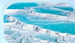
ปราสาทปุยฝ้าย