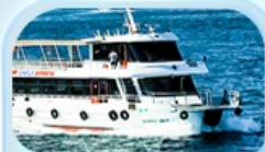
ล่องเรือ ช่องแคบบอสฟอรัส