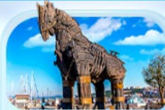
ม้าไม้เมืองทรอย