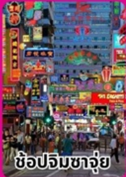
ช้อปปิ้งจางู๊ย