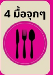
4 มื้อจุกๆ