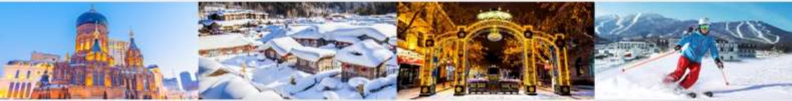
โบสถ์เซนต์โซเฟีย หมู่บ้านหิมะ ถนนคนเดินจงหยาง ลานสกียาปูส์