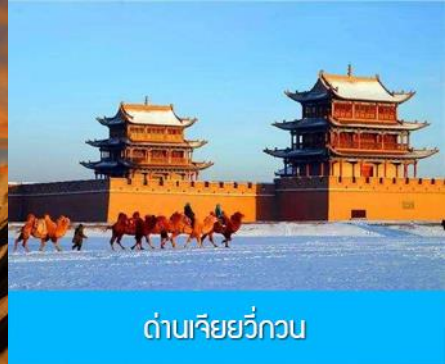
ด่านเจียยวี่กวน