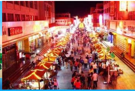
ตลาดกลางคืน ซาโจว