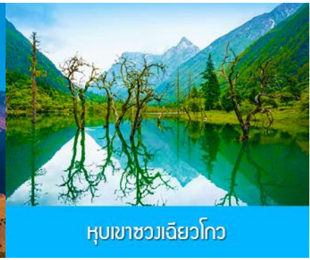
หุบเขาชวงเฉียวโกว