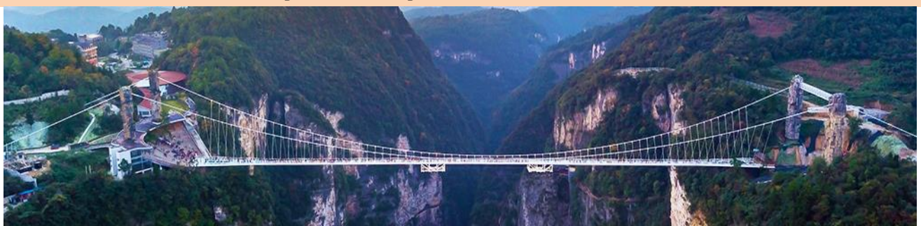
สะพานกระจกข้ามหุบเขาแกรนด์แคนยอน

หมายเหตุ การเลือกซื้อออฟชั่น ทางบริษัทขอสงวนสิทธิ์หากจำนวนผู้ซื้อไม่ถึง 15 ท่าน, ออฟชั่นนั้นไม่สามารถจัดให้ลูกค้าไปเที่ยวได้ จึงเรียนมาเพื่อให้นักลูกค้าได้เข้าใจถูกต้องตรงกัน