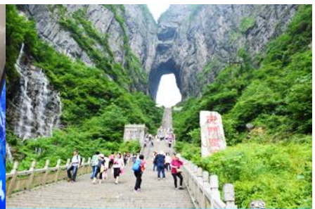
ประตูสวรรค์

หลังอาหารนำท่าน พิชิตยอดเขาเทียนเหมินซาน 天门山 โดยสารกระเช้า (กระเช้ามีความยาวถึง 7.5 กิโลเมตร) อยู่สูงเหนือระดับน้ำทะเล 1,518 เมตร ขณะที่นั่งกระเช้าขึ้นเราสามารถชื่นชมทัศนียภาพที่สวยงามของภูเขาที่มีความอลังการแห่งนี้ สามารถมองเห็นประตูสวรรค์ซึ่งเป็นโพรงหินขนาดใหญ่บนยอดเขา มองเห็นความคดเคี้ยวของ เส้นทาง 99 คืบ และภูเขาสูงใหญ่มากมายที่ตั้งตระหง่านเสียดฟ้า เมื่อถึงยอดเขาเทียนเหมินซาน นำคณะเดินตามเส้นทางชมวิวดูภูเขาและหน้าผา ชมทัศนียภาพจากมุมสูงบนยอดเขา อีกทั้งได้สัมผัสการเดินบนพื้นกระจกใสของ ระเบียงกระจกใสลับหน้าผา เพื่อวัดความขี้ลาดของท่าน สำหรับนักท่องเที่ยวใจเสาะที่ไม่ต้องการเผชิญกับความหวาดเสียว สามารถนั่งรถบริเวณทางออกอีกด้านของ ระเบียงกระจกใสลับหน้าผา 玻璃栈道 ... จากนั้นนำท่านสู่ โพรงประตูสวรรค์ 天门洞 โดย บันไดเลื่อนที่สร้างขึ้นโดยการเจาะทะลุภูเขา 穿山手扶梯 มีความสูงถึง 7 ชั้น เป็นสิ่งอำนวยความสะดวกใหม่ล่าสุดของ เขาเทียนเหมิน ซึ่งหาดูได้ยากตามแหล่งท่องเที่ยวต่างๆ ทั่วโลก บริเวณนี้ ท่านจะได้ถ่ายภาพ ประตูสวรรค์ อย่างใกล้ชิด โดยในปี 1990 มีนักบินผาดโผนชาวรัสเซียขับเครื่องบิน 3 ลำบินลอดผ่านช่องโพรงหินประตูสวรรค์แห่งนี้พร้อมกัน ภาพประวัติศาสตร์นี้ถูกบันทึกและเผยแพร่ไปทั่วโลก ภูเขาเทียนเหมินซานจึงเป็นที่รู้จักของนักผจญภัยทั่วโลกที่อยากเดินทางมาสัมผัสด้วยตัวเอง..