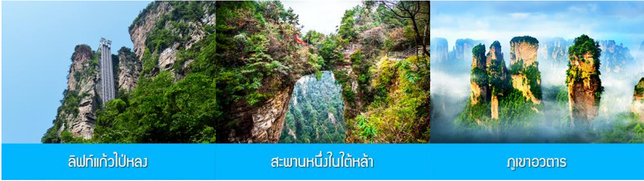
ลิฟท์แก้วไปหลง