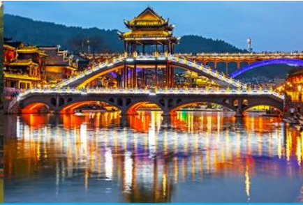
สะพานหงเจียว