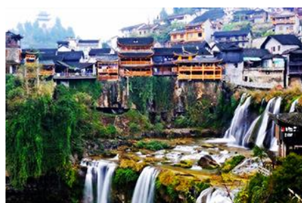
เมืองโบราณฟงหวง

https://www.cielchine.com/zhangjiajie-hotels/zui-xiang-xi-hotel/