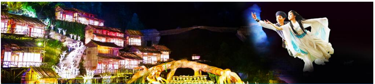
The Love Story of a Wooden Man and Fairy fox

จากนั้นนำท่านชม ตึกมหัศจรรย์ 72 ชั้นแห่งเมืองจางเจียเจีย 张家界七十二奇楼 แลนด์มาร์คใหม่ล่าสุดของเมืองจางเจียเจียที่เป็นเสมือนแม่เหล็กดึงดูดนักท่องเที่ยวและผู้มาเยือน แหล่งท่องเที่ยวที่กลายเป็นแลนด์มาร์คแห่งใหม่ ถูกสร้างขึ้นโดยนำเอาจุดเด่นของเมืองจางเจียเจีย มารวมกัน โดยมีอาคารสูงที่สร้างจำลองถ้ำประตูสวรรค์ บ้านยกพื้น โบราณที่เป็นบ้านพื้นเมืองของชาวถู่เจีย.