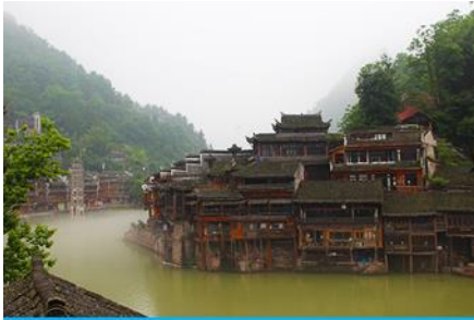
เมืองโบราณฟงหวง