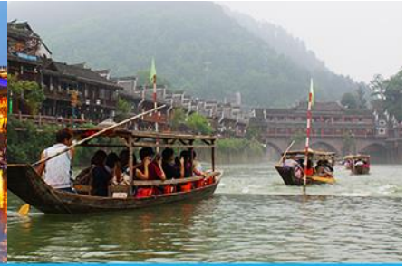
ล่องเรือแม่น้ำถั่วเจียง

วันที่สาม เมืองจางเจียงเจี๋ย-ออฟชั่นไกด์ขายสะพานกระจกข้ามเขาแกรนด์คอนยอน - เมืองโบราณฟงหวง-ล่องแม่น้ำถั่วเจียง-นอนในเมืองเก่าฟงหวง