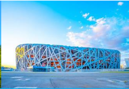
สนามกีฬาโอลิมปิก