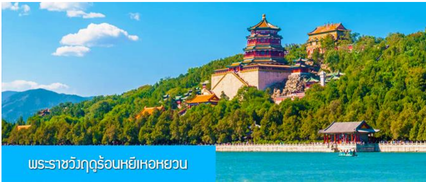
พระราชวังฤดูร้อนหยี่เหอหยวน