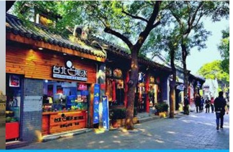
ซอยหนานหลั่วกู่เซียง