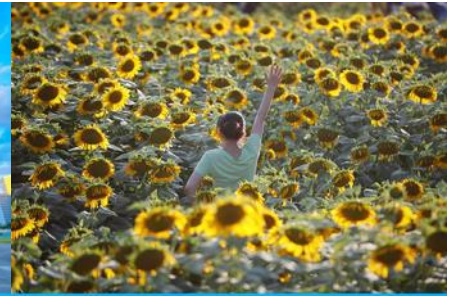
ดอกทานตะวันในสวนโอลิมปิก

วันที่สาม กรุงปักกิ่ง - กำแพงเมืองจีนด่านจวิยงกวน – ศูนย์จำหน่ายหยก-สนามกีฬารังนก(ชมด้านนอก) - ชมดอกทานตะวันในสวนโอลิมปิก