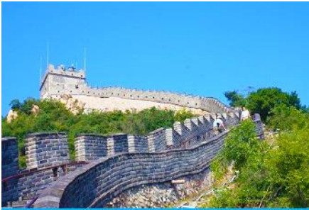
กำแพงเมืองจีนด่านจวิยงกวน

พักที่ HOLIDAY INN EXPRESS HTL OR ROYARD HTL 4* หรือโรงแรมในระดับเดียวกันในเมืองปักกิ่ง