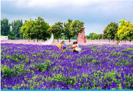
ทุ่งดอกลาเวนเดอร์