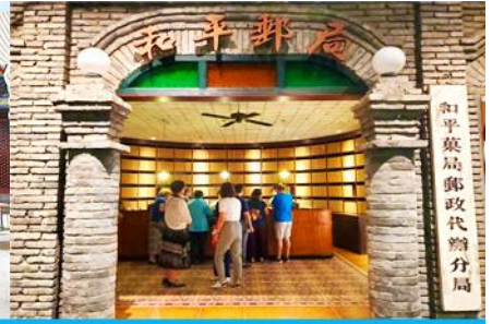
เมืองโบราณจำลอง