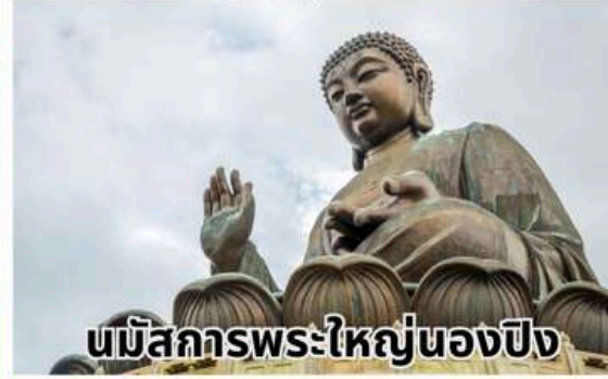
นมัสการพระใหญ่ของปิง