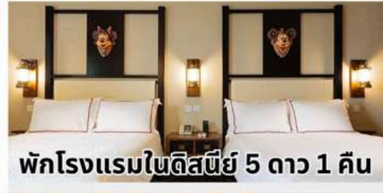
พักโรงแรมในดิสนีย์ 5 ดาว 1 คืน