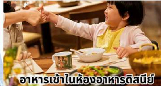
อาหารเข้าในห้องอาหารดิสนีย์