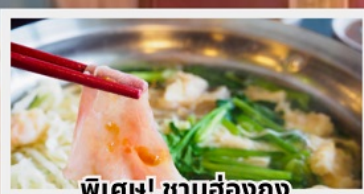
พิเศษ! ซาบูฮ่องกง