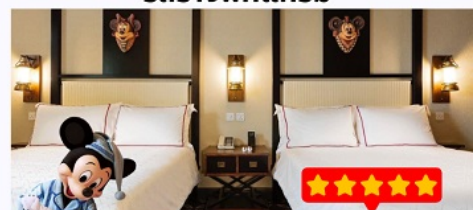
พัก Disney Explorers Lodge 5 ดาว 1 คืน