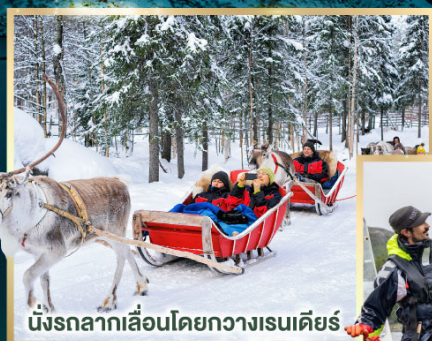
นั่งรถลากเลื่อนโดยกวางเรนเดียร์