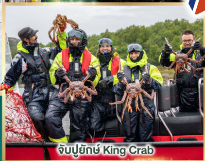
จับปูยักษ์ King Crab