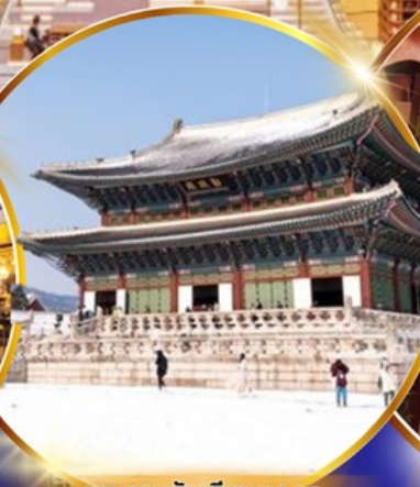
พระราชวังเคียงบอกคุง