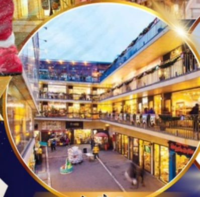
ถนนช้อปปิ้งอินชาง

ใหม่!! ห้องสมุดสุดอลังการที่ชวอน ชมจอ LED เสมือนจริงขนาดยักษ์ สนุกสุดมันส์ที่สวนสนุกเอเวอร์แลนด์ ชมพระราชวังเคียงบอกคุง ถนนวัฒนธรรมอินชาง อิสระช้อปปิ้งคังนัม เมืองดง Lotte Duty Free